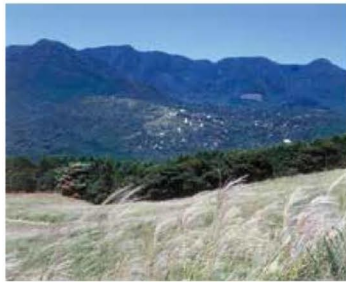
▲細野高原から天城山を望む