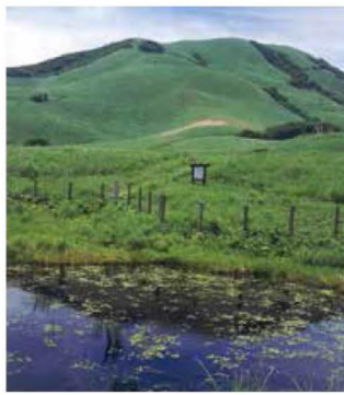
▲桃野湿原から三筋山を望む

わらび狩りの受付所とパラグライダーの基地・伊豆フライトハウスがある分岐から左に曲がり、舗装された林道を下る。山神社の先、庚申塔がある分岐から左に駅への近道を下れば駅は近い。 このコース、駅までの距離が長いので、陽の短い冬場は避けた方がよい。途中からタクシーを呼ぶことも可能だが、どこまで迎えに来てくれるかは相談。