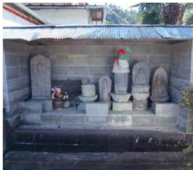
▲下湯舟公会堂の石造物