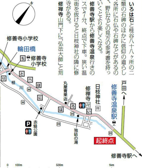
0 100m 500m 1km