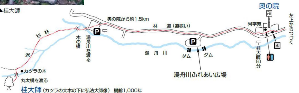
桂大師(カツラの木の下に弘法大師像) 樹齢1,000年

またた石塔があり、側面に大きな「い」の文字が彫られている。これが「いろは歌」の最初の「い」の字でいろは道の最初の道標である。いろは石を順にみつめて奥の院まで行こう。 奥の院は弘法大師が18才の時、修行した所で、駆籠の窟という岩洞があり、その岸壁には阿吽の滴がある。滴の前には弘法大師降魔殿という修行石がある。 桂大師は弘法大師が朱塗沢に修行に入った時、四国から持ってきたカツラの杖を地面に挿し忘れてしまい、それが成長したと伝わる大木である。現在の木は三代目で樹の高さ30m、幹回り周囲が7.2m、樹齢は1000年と言われ、県の天然記念物に指定されている。根元の祠には大師の石仏が祀られている。 桂大師へは奥の院から湯舟川沿いの林道を1.5km行ったら広場から川を渡りスギ林の道を登った所にある。 毎年、春の静寂・秋の静寂と題した修禪寺から奥の院までのウォーキングが催されている。特製弁当付きで参加料は1000円。