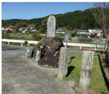
▲いろは石と88ヶ所碑