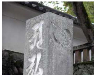
▲「い」の字の石塔(修禪寺)